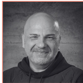
Pitt Knopel Salonberatung PLZ 01-16